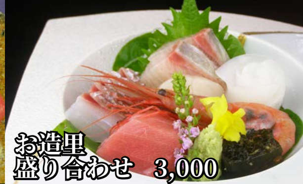
お造り盛り合わせ 3,000