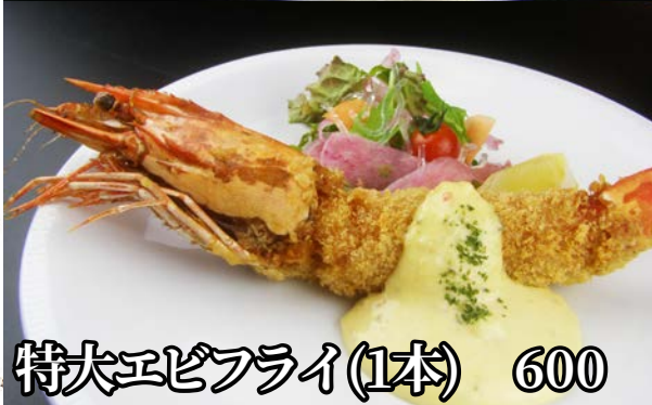
特大エビフライ(1本) 600