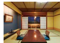
スタンダード客室

ユニバーサルルーム バリアフリーのトイレ・浴室など、車椅子等での過ごしやすさと同行者の方々のケアのしやすさが、随所に考慮されているお部屋です。