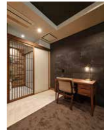
こだわりのデスク