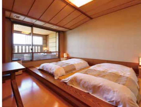
温泉露天風呂付洋室(ツイン)