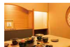
個室食事処「季風庭」