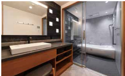
バスルーム・パウダールーム