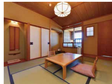
温泉露天風呂付和室