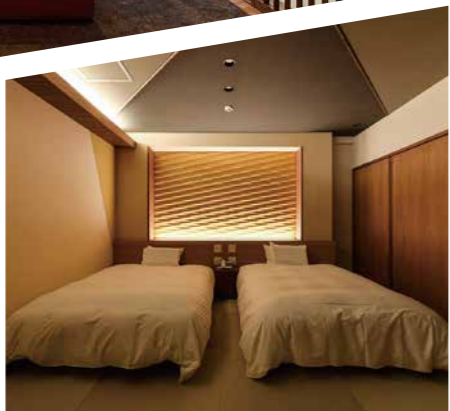
寝室 畳敷きならではの和室は安らぎを感じられます。幅が広くゆったりとしたベッドで快適にお休みいただけます。