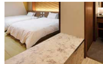
大きい荷物も置ける バゲージラック