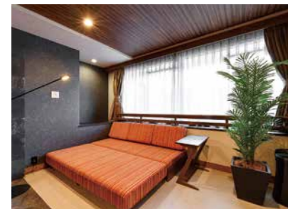
ソファにもなるエキストラベット